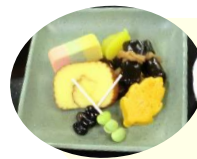
おせち盛り合わせ

全食事形態におせち盛り合わせを提供しました。常食は「伊達巻、昆布巻、黒豆、青豆、花三色、ふんわり木の葉豆腐（かぼちゃ）、いもきんとん」となっております。