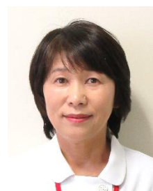
医療法人 寶樹会 仙塩利府病院

*2020年度採用試験は8月、10月の第1土曜日です。多数のご応募をお待ちしております。詳細はホームページ又は総務課までお問い合わせください。